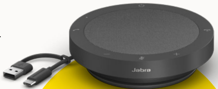
VARIANTES DE MS TEAMS Y UC

Para ayudar a cuidar nuestro planeta, tenemos presente la sostenibilidad cuidadosamente en cada etapa del desarrollo de un producto. La carcasa exterior del Speak2 40 se elabora con más de 50% de materiales sostenibles**, con una serie de piezas integradas que se pueden reparar o reemplazar. Mejor sostenibilidad = mayor vida útil del altavoz = llamadas de gran calidad para usted y su equipo durante muchos años.