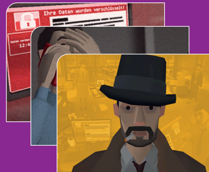
IM NETZ DES SOCIAL ENGINEERS

Und dies ist bei weitem nicht das einzige Format in unserem Repertoire. 'Spielerisch Lernen' ist der Leitsatz, nach dem wir arbeiten. Neben unserem Detektiv gibt es noch weitere Awareness Games zu entdecken, die Wissen spielerisch und nachhaltig vermitteln. So widmen sich unsere gamifizierten Sondertrainings nicht nur dem Thema Social Engineering, sondern unter anderem auch Phishing und Ransomware.